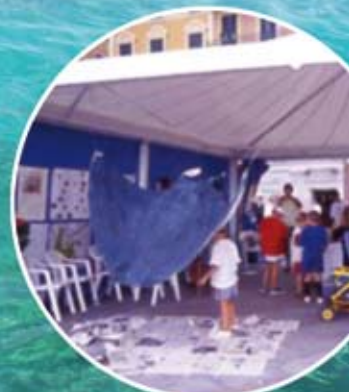
PROGETTO ISHMAEL (Monitoraggio Cetacei)